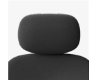
In hoogte verstelbaar