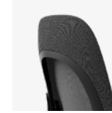
Zit- en rugframe