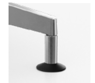
5-teens voerster met glijders