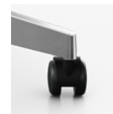
5-teens voersters wielen 50 mm