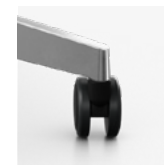
5-teens voerster wielen 65 mm